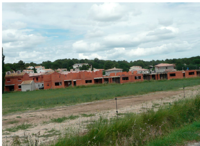
Lotissement chemin de Malerive.

Terminés, seront-ils au moins en harmonie avec le cœur du vieux village ?