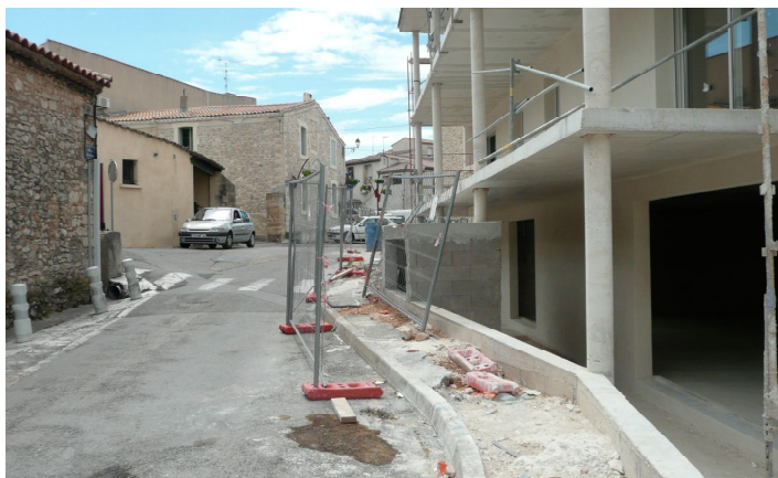
Chantier centre village.

Il n'y a qu'à Teyran que l'on peut voir cela : ne pas élargir une voie publique déjà étroite, pour accorder une excroissance à un ouvrage privé...C'est vraiment n'importe quoi ! B.P.