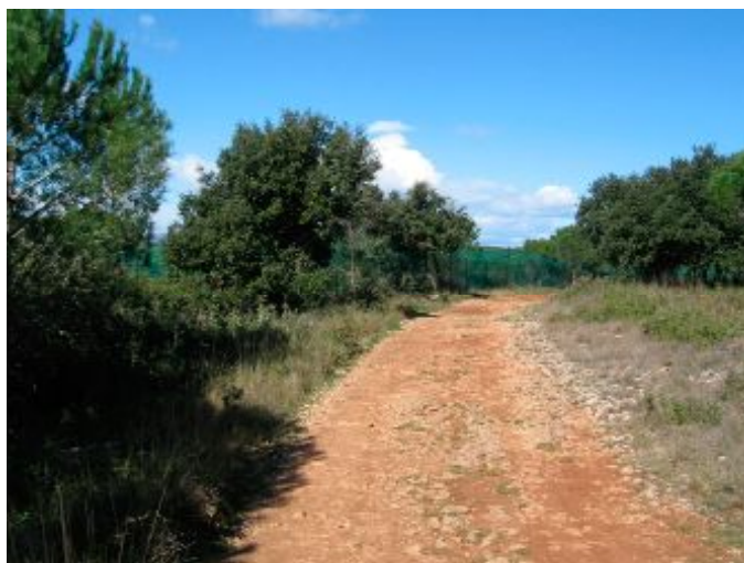
A gauche du chemin on voit une partie de la même zone avant débroussaillage

Heureusement, répétons-le, il n'est nécessaire qu'au voisinage des lieux de vie (50m en général, parfois 100m) et au voisinage des voies qui amènent à ces lieux de vie.