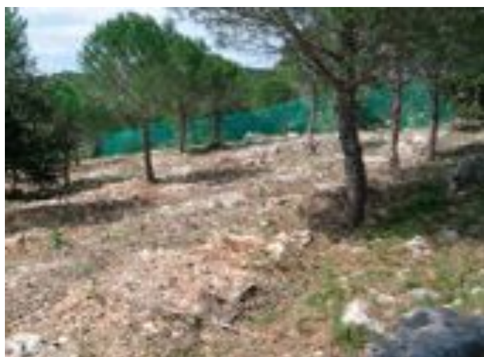
Résultat du débroussaillage à côté du paint-ball.

Au delà des lieux de vie il est en général nécessaire d'entretenir la forêt pour la faire prospérer ; en particulier pour des forêts reboisées après incendie comme à Teyran. On plante plus d'arbres que nécessaire pour prévenir les pertes mais aussi pour recréer un milieu avec un sous-bois dense et propice à la réapparition de diverses essences. L'entretien pourra donc amener à abattre certains arbres pour permettre à de nouvelles