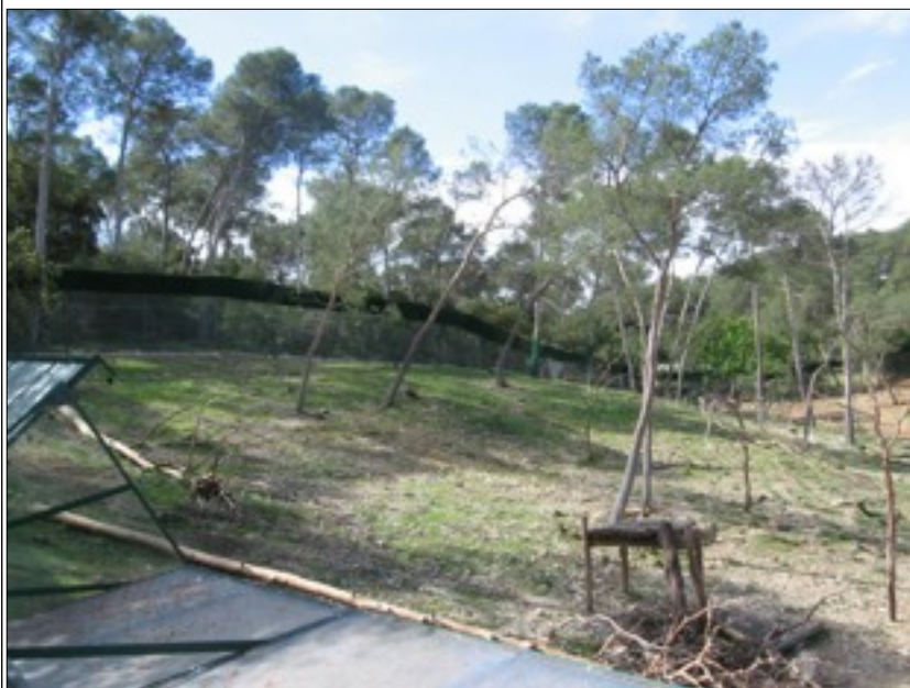
Enclos des singes magot au zoo de Montpellier

b- Les singes magots vont non seulement détruire le sous-bois mais, comme cela s'est produit dans des parcs analogues, ils risquent de s'attaquer aussi aux grands arbres.