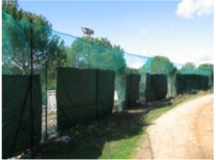
Le long du paint-ball

La lecture du dossier de ce parc de singes, que l'on peut trouver sur le site de la mairie, affirme qu'une des motivations principales de ce projet est la sauvegarde de cette race de singes. Notre contact avec les promoteurs et la logique nous laissent penser que c'est la rentabilité financière qui est la contrainte principale et que la sauvegarde de la race ne peut être qu'un corollaire possible. Le zoo de Montpellier offrant gratuitement un très grand enclos de ces singes, il faut d'autres centres d'intérêt que ces singes eux-mêmes. Il est donc prévu une aire de jeux et loisirs aussi grande que l'enclos des animaux : jeux gonflables, parcours à thème, restauration, magasin de produits dérivés ?... Un équipement important de cette zone nous fait craindre pour la végétation, actuellement très dense.