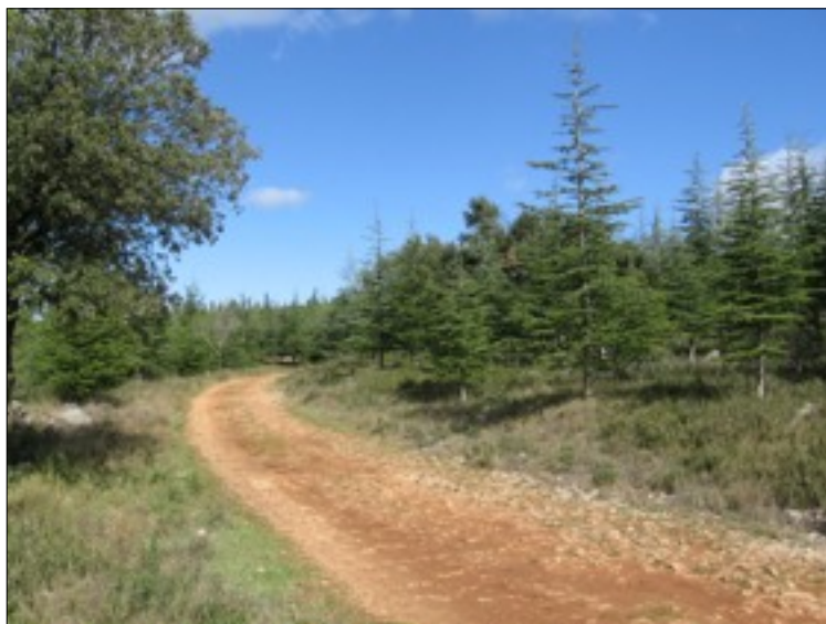
Boisement de la partie est de la ceinture verte de Teyran

Un des arguments entendu pour justifier la création du parc de singes à cet endroit : « personne ne rentre dans les sous-bois, les promeneurs restent sur les chemins ». Or l'une des richesses de ce secteur est précisément la densité et la difficile accessibilité de ses sous-bois.